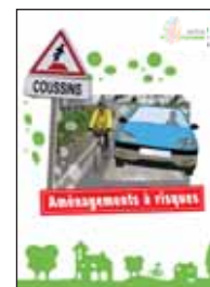
Analyse d'un aménagement à haut risque.

Tous ces documents n'ont pas pour objectif de se substituer aux diverses directives et circulaires existantes tel que , le RAC (Recommandations pour les aménagements cyclables), document technique du Certu qui aborde déjà ces préoccupations ; mais de les compléter ou de les réactualiser en fonction de l'expérience des pratiques au sein de la FFCT.