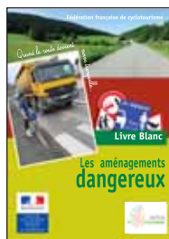
Que faire face aux points noirs routiers ?